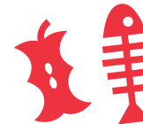
Avanzi di cibo