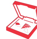
Cartone sporco di cibo