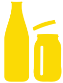
Bottiglie e barattoli di vetro