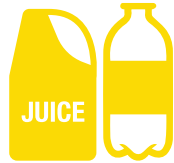
Bottiglie e contenitori di plastica