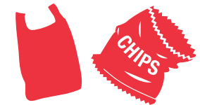
Plastica morbida (o portare nel bidone REDcycle)