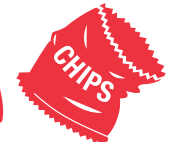
Plastiques souples (On peut aussi les déposer dans un bac REDcycle)