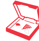
Carton sali d'aliments

Ne mettez pas ces objets dans un bac de collecte. Ils sont à déposer au dépôt de recyclage de votre quartier.