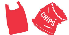
Plastica morbida (o portare nel bidone REDcycle)