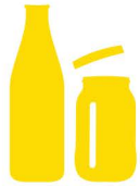
Bottiglie e barattoli di vetro