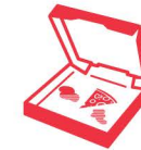
Cartone sporco di cibo

Questi oggetti non possono andare in nessuno dei bidoni sul marciapiede. Portali al tuo centro di raccolta locale.