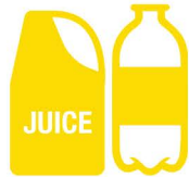
Bottiglie e contenitori di plastica