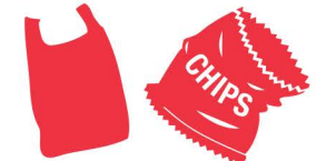
Plastiques souples (On peut aussi les déposer dans un bac REDcycle)