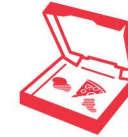
Carton sali d'aliments

Ne mettez pas ces objets dans un bac de collecte. Ils sont à déposer au dépôt de recyclage de votre quartier.