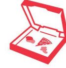
علب الطعام الورقية المتسخة

لا يمكن وضع هذه العناصر في أي صندوق قمامة يجمع من على الرصيف. خذها إلى مركز تدوير النفايات المحلي الخاص بك. لمزيد من المعلومات الرجاء الاطلاع على الموقع www.wastenet.net.au/hhw