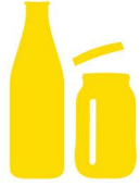
القناني والقوارير الزجاجية