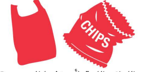
اللداائن اللينة (أو خذها إلى صندوق (REDcycle)